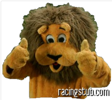
Sochalion, la bébéte Sochaux

( NDLR : cet article fait partie d'une série d'articles au ton décalé et résolument second degré. A lire avec précaution. :baillements: Si tu es professeur de géographie, le courrier est à adresser à Redaction , en te remerciant. )