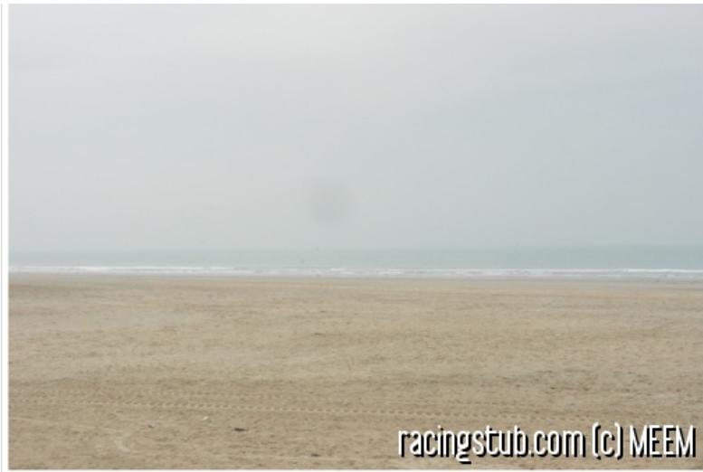
A Sochaux, la mer donne à la fois sur l'Angleterre, la Norvège et