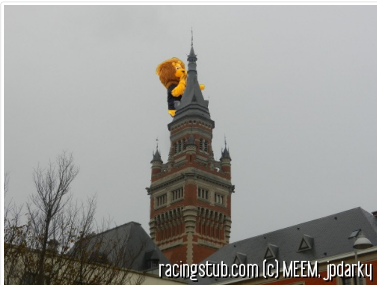
Sochalion escaladant le beffroi de Sochaux

A Sochaux, on construit des voitures. Oui, je sais, on est au courant. Et des vélos. Et des moulins à café. Bref, que de bonnes choses, alors qu'à Dunkerque, on fabrique de l'acier et on embouteille le liquide gazeux marronnasse qui dissout mieux la rouille que le Framéto (t'as vu ça juliou68 , je case Framéto dans le papier, la classe non ?) et on pêche le hareng. Tout cela démontre à quel point Dunkerque et Sochaux sont semblables.