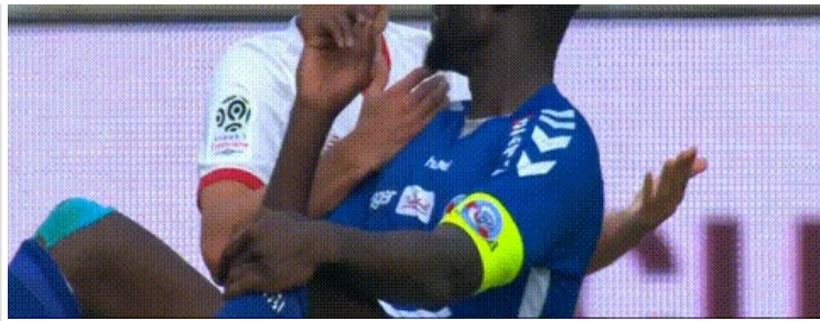
Si tu es sage, je t'apprendrai à arracher les tibias sans que ça fasse mal.