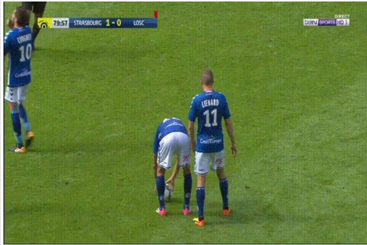
Laisse Jonas, regarde faire le pro...