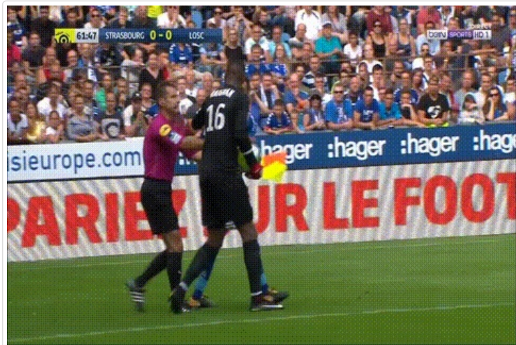
Menteur, c'est pas toi Ben Stiller !