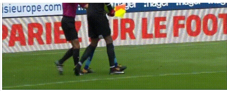
Mais t'avais dit qu'on ferait des knackis...