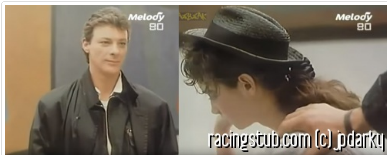
Figure 2 Herbert et Boy George montrant que l'amour romantique entre hommes ne doit plus être un tabou.

Et Herbert, il fait pas que les femmes, ben non, Herbert il était suffisamment ouvert pour tenter l'aventure homosexuelle. Regardez ce document d'époque (cf. Figure 2) où on le voit clairement accoster Boy George avec un sourire gourmand.