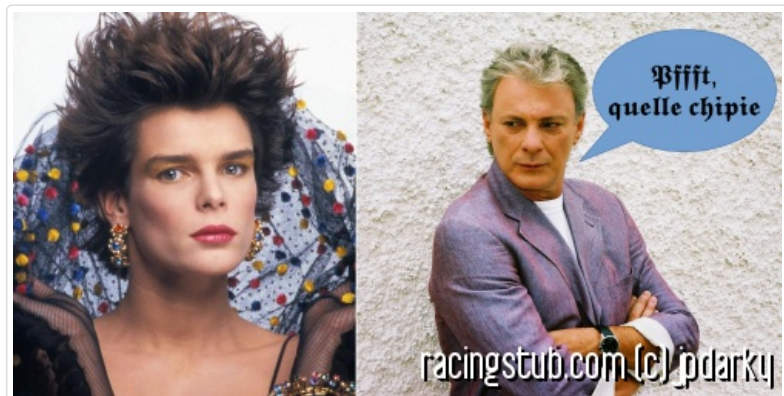
Figure 1 Attention pour nos amis atteints de daltonisme, la veste portée par notre spécimen de droite (De droite sur l'illustration, nous ne pouvons pas nous avancer quant à ses orientations politiques (Et nous ne nous permettrions pas de les révéler si nous les connaissons. Déontologie, rectitude et loyauté sont les piliers de notre éthique)) peut provoquer une crise d'épilepsie.

A propos de culture, puisqu'on parle de Stéphanie de Monaco, comparons donc l'apport intellectuel et artistique de ce rocher princier d'opérette et celui de notre Alsace unie qui est vraiment super. Lisons d'un côté un extrait de l'oeuvre de Stéphanie de Monaco, disons " Ouragan ", et, de l'autre, un extrait de ce qui restera comme un climax de la somme des pensées d'un des précurseurs du mouvement #MeToo, Herbert Léonard, bien sûr, dans " Quand tu m'aimes ". Afin de comparer, de jauger et d'évaluer, une seule méthode : la méthode scientifique. Observons les deux spécimens considérés, cf. Figure 1. Les images parlent d'elles-mêmes (c'est une image (au sujet des images), c'est à dire, il n'y a pas vraiment des assemblages de pixels plus ou moins organisés qui se mettent à parler). La princesse odieusement peinturlurée, les cheveux défaits, plus ébouriffés que ceux d'une femme de chambre du Sofitel de New York en mai 2011, le cou étrangement masculin, une ambiguïté satanique pour guider la Jeunesse dans le stupre de la promiscuité interlope. Et de l'autre côté, le bel homme, le bel homme à la fois mystérieux et rassurant. Le papa idéal de " Un papa, une maman ". Une bouche pas trop lippue, une montre patriarcale et stable comme un tabouret en bois. Bon, pour le mascara, faut voir.