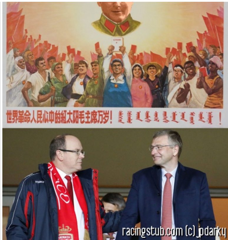
Figure 4 (Haut) Glorieux Guide Guidant le Peuple de le Racing vers les sommets du football tout en gardant fermement au coeur la probité, l'humilité et la douceur feutrée de la tempérance. (Bas) Spectacle affligeant et à peine dissimulé du potentat local manipulant le chic D. Rybolovlev telle une marionnette via un habile mécanisme dissimulé dans dos. Regardez cette méchanceté dans le regard qui perce de ces petits yeux engoncés derrière ces lunettes probablement obtenues à grand prix auprès du Musée Augusto Pinochet de Danzig. Brrr.