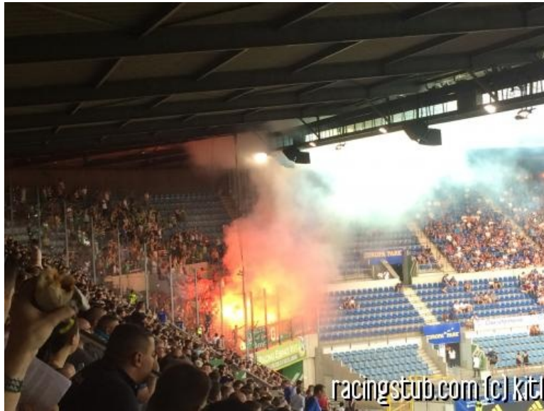
Les fans du Maccabi mettront la pression sur le Racing au match retour

★★★★★ (11 notes) 📅 01/08/2019 05:00 📍 Avant-match 🌐 Lu 4.693 fois 👤 Par kitl 🗨️ 10 comm.