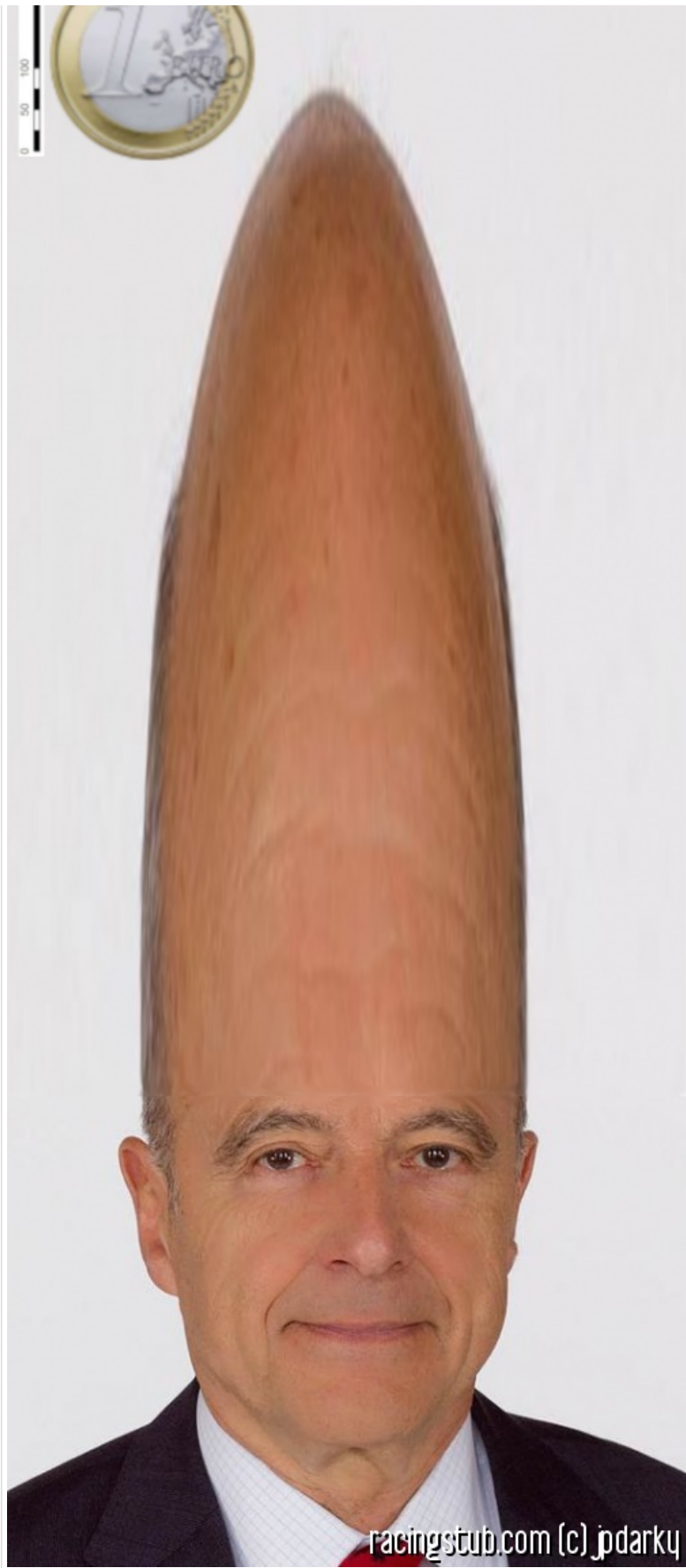
La Rue Sainte Catherine, vue du Ciel.

Tous ces infimes signes de distinction de classe, imprimés dans l'urbanisme lui-même, dans les façades des vieux hôtels particuliers en pierre blonde, définissent le discutable « chic bordelais » qui lui vaut d'être le théâtre de Section de recherches. Série française à budget modéré mettant en scène la police scientifique de notre glorieux pays. Avec test PCR minute en appuyant sur la machine qui fait « bip-bip ». On est pas chez le gendarme de Saint Tropez ou dans Plus Belle la Vie; à Section de recherche, c'est du sérieux. Quand le héros souffle d'impatience par les narines, comme ça, on sait que le numéro de téléphone du coupable va sortir rapido du test PCR.